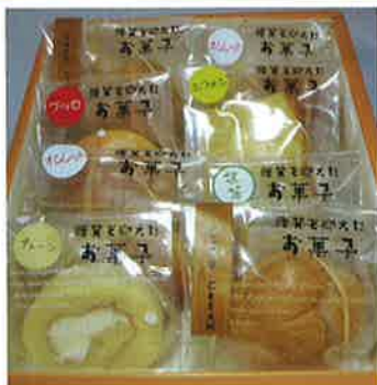
製品名 糖質を抑えたお菓子 事業所 スイーツラボトリー(株)

■所在地/松山市針田町100-4 TEL:089-971-8860 FAX:089-989-6035 ■e-mail/sweetslaboratory@gmail.com ■価格(税抜き)/110円~150円(個包装分) ■規格・内容量/15g~40g(個包装分) ■製品概要/「糖質を抑えても美味しいお菓子が食べたい!」そんな要望に応じて作りあげたスイーツです。従来の健康志向ユーザー向けの商品から一般ユーザーまで、身近で何度でも美味しく食べられる、体に優しい未来型スイーツを誕生させました。