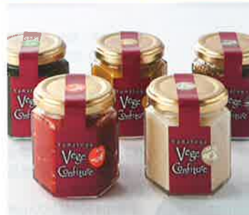
製品名 大和屋ベジスイーツ ベジコンフィチュール