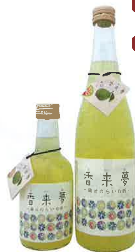
製品名 蔵元のらいむ酒 香来夢(こらいむ)