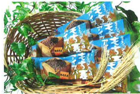
製品名 まるっと愛媛 もち麦アイスパー 事業所 南商事(株)

■所在地/松山市南高井町1682-2 TEL:089-975-3738 FAX:089-975-4290 ■URL/http://www.minami-shoji.jp/ ■e-mail/c-yukisada@minami-shoji.co.jp ■価格(税抜き)/120円 ■規格・内容量/80ml ■製品概要/愛媛県産100%の素材の旨みとアイスのココの絶妙な絡みが楽しめるもち麦アイスパーです。日本一の生産量を誇る愛媛のもち麦の香ばしさとアイス本来の濃厚ミルクの美味しさは、故郷・愛媛の懐かしい味を思い出す、心あたたまるアイスです。