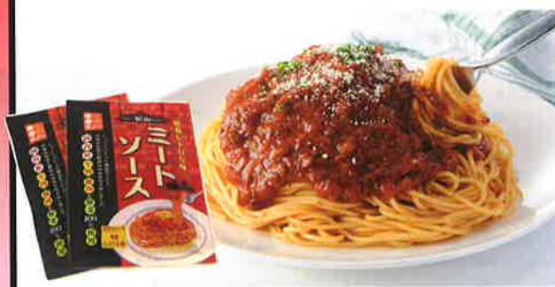
製品名 松山昭和ミートソース 事業所 義農味噌(株)

■所在地/伊予郡松前町永田345-1 TEL:089-984-2135 FAX:089-984-7300 ■URL/http://www.gino-miso.co.jp/ ■e-mail/info@gino-miso.co.jp ■価格(税抜き)/334円 ■規格・内容量/100g(1~1.5人前) ■製品概要/国産原料にこだわった昔懐かしい昭和レトロな甘口のミートソースです。じっくりコトコト煮込むことでお肉の旨みと野菜の甘みを引き出しました。昔、松山・銀天街にあったスパゲティの名店の味を再現したノスタルジックで優しい松山の逸品です。